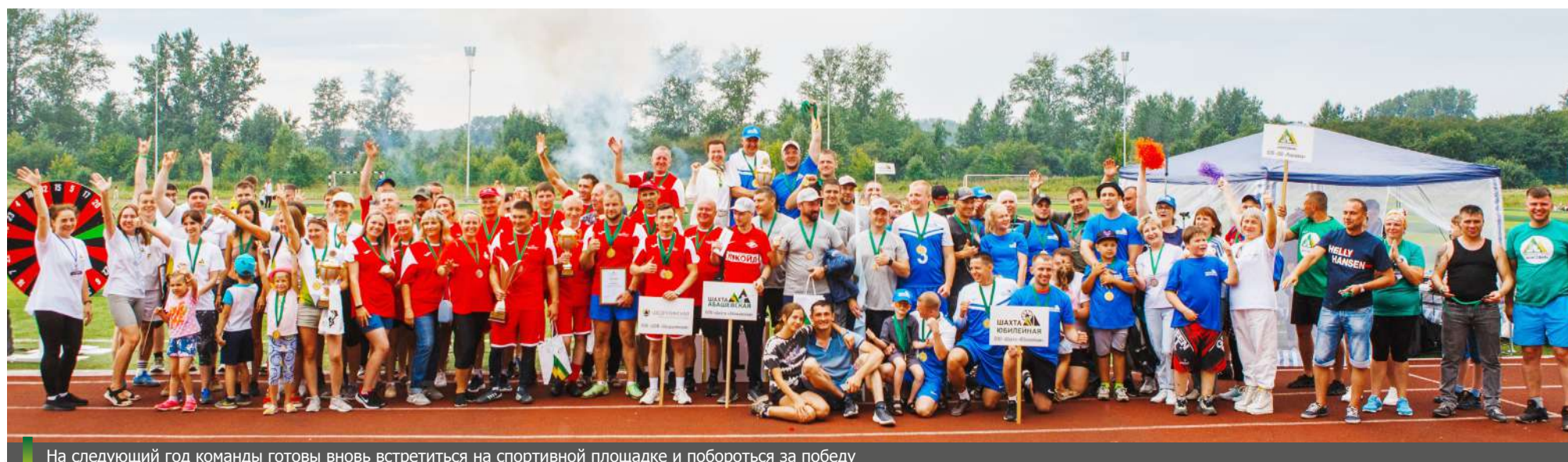
На следующий год команды готовы вновь встретиться на спортивной площадке и побороться за победу

Сканируй QR-код и смотри видео со спартакиады