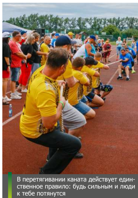
В перетягивании каната действует единственное правило: будь сильным и люди к тебе потянутся

Достоинством завершения спартакиады стали состязания по перетягиванию каната. Второй год подряд победу в этом виде спорта одерживают обогатители «Коксовой». Прокопьевские коллеги в условиях ограничения общего веса команды 520 килограммами легко соперничают с остальными.