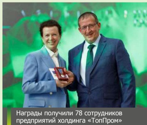
Награды получили 78 сотрудников предприятий холдинга «ТопПром»