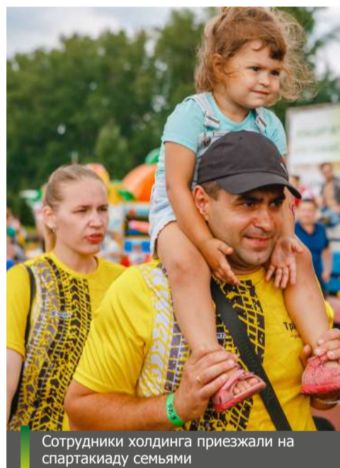
Сотрудники холдинга приезжали на спартакиаду семьями