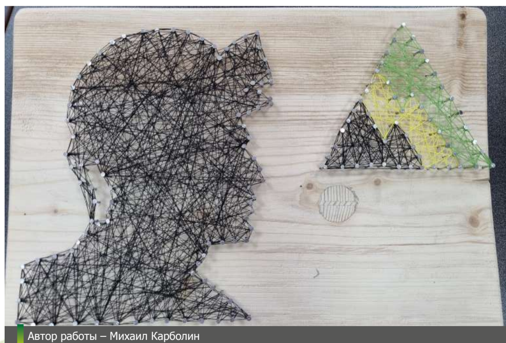
Автор работы – Михаил Карболин

Победителям вручены ценные призы от холдинга «ТопПром», а всем конкурснтам – поощрительные подарки за участие.