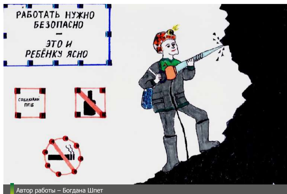
Автор работы – Богдана Шпет