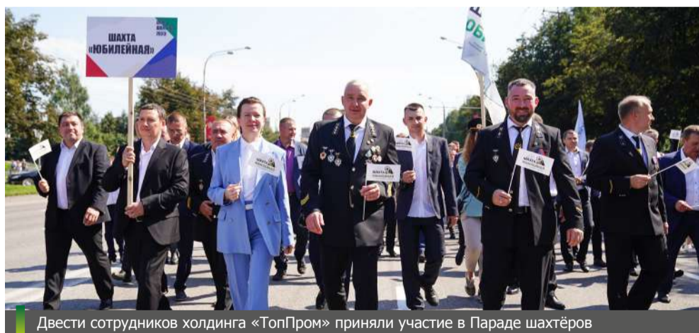
Двести сотрудников холдинга «ТопПром» приняли участие в Параде шахтёров

В этом году Парад шахтёров в Новокузнецке собрал 15 тысяч представителей Южно-Кузбасской агломерации. Горняцкий труд неразрывно связан со многими сферами экономики, поэтому в шествии «Шахтёрская слава Кузбасса» приняли участие не только горняки и обогатители, но и металлурги, железнодорожники, студенты высших и средних образовательных учреждений.