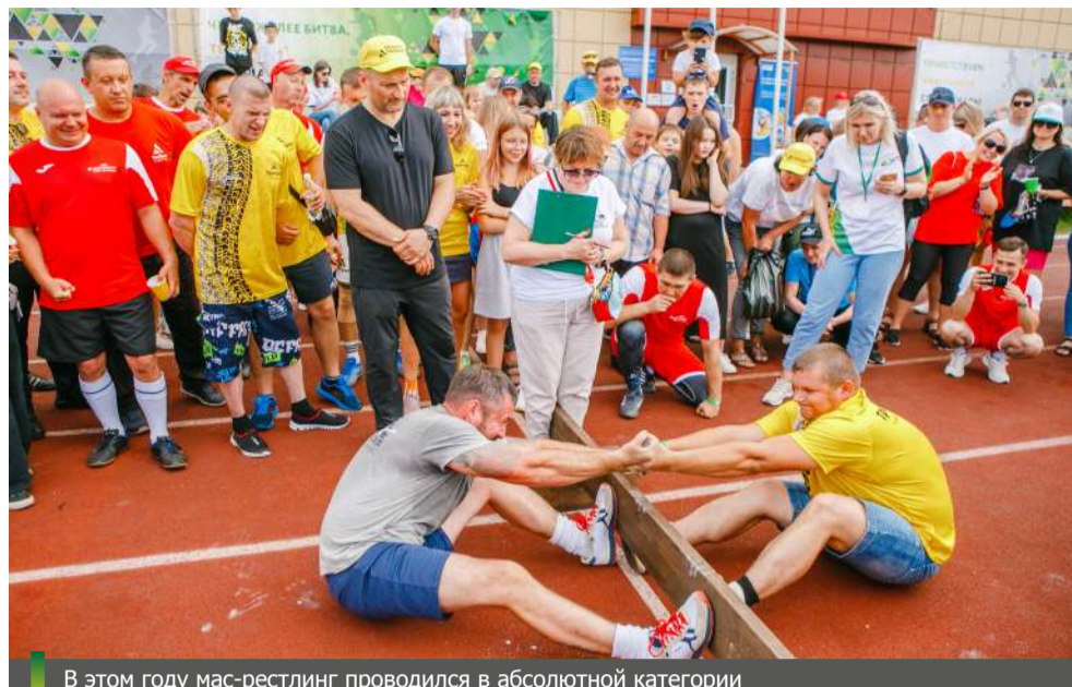
В этом году мас-рестлинг проводился в абсолютной категории

– В прошлом году я проиграл, уступив победителю балл. Поэтому я готовился к