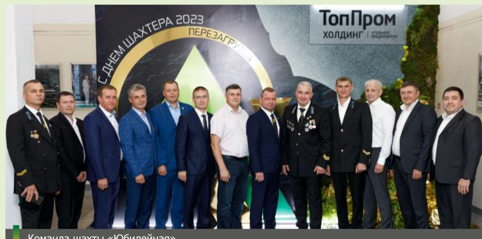
Команда шахты «Юбилейная»

В завершение праздничного концерта по-новому прозвучал гимн холдинга «ТопПром». Несмотря на изменённую аранжировку, слова остались прежними: «ТопПром» – от судьбы мы подарков не ждём! «ТопПром» – всегда лучшие в деле своём! И все знают, что не подведёт «ТопПром!» Перегрузка состоялась! Идём вперёд, к новым победам!