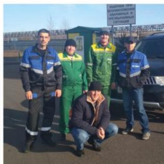
Всех победителей наградили выпелами «Лучший водитель» и денежными премиями. Остальные участники конкурса,

которые не смогли в этот раз завоевать призовые места, также были поощрены денежными премиями.